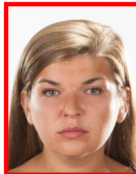
prześwitlenia od tła