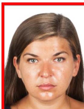
refleksy na twarzy