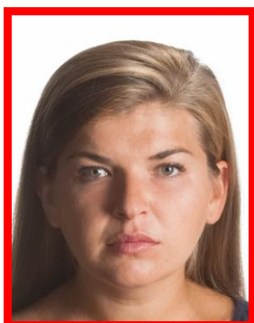
nierównomierne oświetlenie twarzy

Twarz musi być oświetlona równomiernie. Niedopuszczalne są refleksy (odbicia światła na skórze czy włosach powodujące białe plamy w tych miejscach) oraz cienie na twarzy.